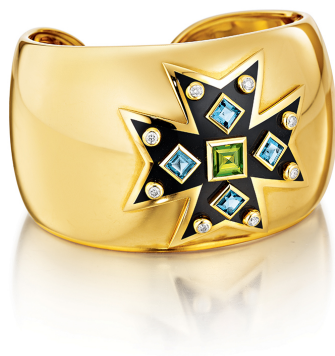
圖 3：馬爾他十字手鐲 6 。