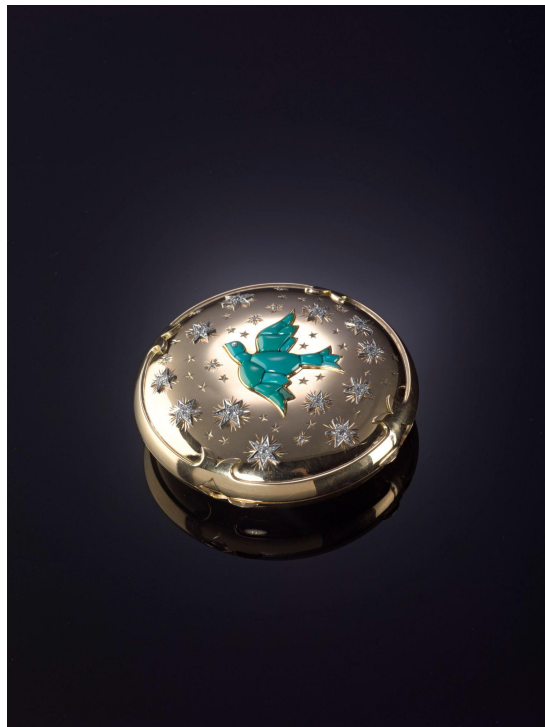
圖 8：粉盒，Verdura，約 1950 年，綠松石、鑽石和黃金，直徑 7.9 x 高 2.13 公分，兩依藏博物館藏。

兩依藏博物館收藏了 5 件由 Verdura 在 1930 至 50 年代設計和生產的粉盒。以下粉盒體現了 Verdura 的獨特風格——都是由黃金和多種寶石組合而成。