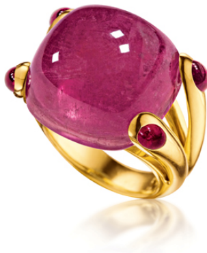
圖 11：紅碧璽和粉紅碧璽糖果戒指 14 。

第三款也是最後一款本館珍藏的 Verdura 粉盒就是橢圓形黃金粉盒（圖 10），中央以密釘鑲粉紅剛玉和鑽石為點綴。切割方法對粉紅剛玉而言極其重要，因它會影響光線的數量和透出的顏色，從而增強寶石的美感。橢圓形切工和枕形切工是最常見的切工類型，從這個粉盒可見 15 ，這種切工可以最大限度地展現粉紅色藍寶石的美感。隨著寶石切工的不同，粉紅色藍寶石的顏色從淺粉色變為深粉色。這個粉盒的風格讓人聯想起維爾杜拉的「糖果戒指」（圖 11），該戒指於 1942 年首次設計和製造，是維爾杜拉最早和最經典的設計之一。