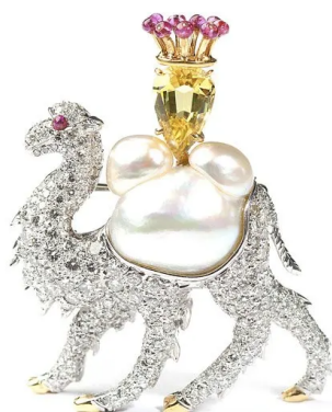
圖 1：鑽石和寶石鑲嵌駱駝胸針，Verdura。約翰莫蘭拍賣行。2013 年 5 月 22 日。

Fulco di Verdura（原名 Fulco Santostefano della Cerda）於 1898 年出生於西西里島巴勒莫的一個貴族家庭。他們居於 Villa Niscemi 亞熱帶花園環抱宅邸，屋內房間佈置豪華，經常邀請歐美的上流社會客人在住處舉辦奢華的化裝舞會。Fulco 小時候養過包括一對狒狒和一隻名叫莫莫的駱駝等寵物。這種充滿異國情調的成長經歷充分體現在他後來異想天開的動物珠寶設計中 1 。其中一個例子是這枚 1967 年製作的鑽石和寶石鑲嵌駱駝胸針，由鉑金、一顆人工養殖黑珍珠、170 顆全切割圓形鑽石和一顆黃色剛玉製成。