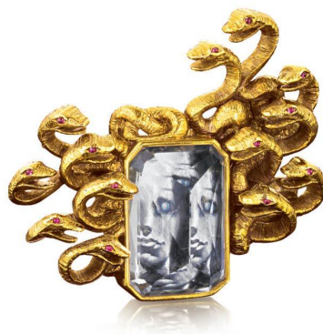
圖 4。黃金、摩根石和紅寶石製「美杜莎」胸針，帶有 Salvador Dalí 的微型畫，1941 年。Fulco di Verdura 公爵和 Salvador Dalí 於 1941 年合作的五件原創珠寶之一。最初來自 Millicent Rogers 的收藏。

Fulco 認識了西班牙超現實主義藝術家 Salvador Dalí（1904-1989 年），兩人於 1940 年合作製作了他們的首個超現實主義珠寶系列。先由 Dalí 製作五幅微型畫，再由 Verdura 用珠寶表裝，這件作品在紐約現代藝術博物館展出並出售 8 。此次合作突破了珠寶與藝術的傳統界限。