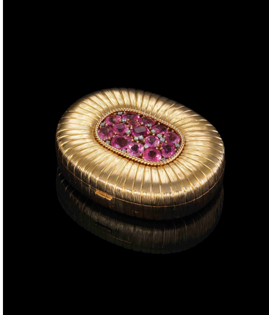
圖 10：粉盒，Verdura，約 1950 年，黃金、鑽石和粉紅剛玉，長 7.7 x 寬 6.2 x 高 2.1 公分，兩依藏博物館藏。