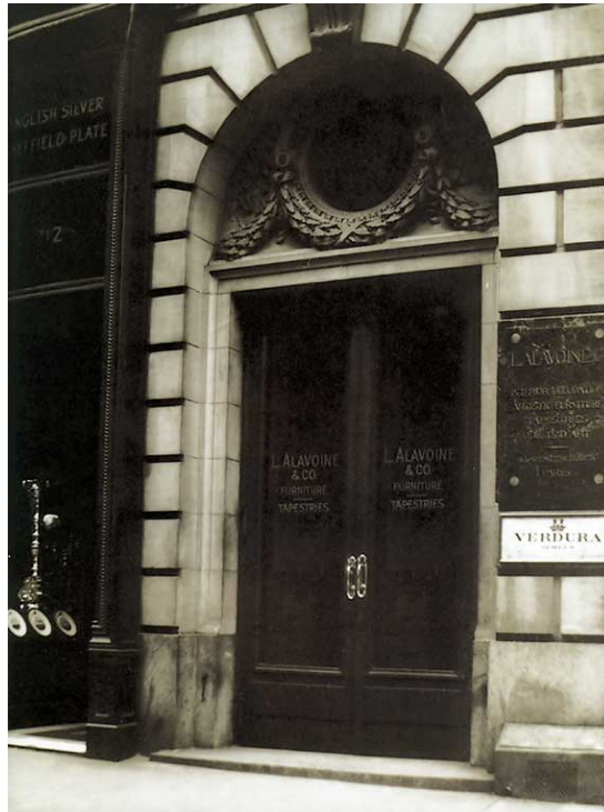
圖 4：紐約第五大道沙龍，Verdura，1939 年。

1939年9月1日，在 Vincent Astor 和 Cole Porter 等朋友的資助下，Fulco 在紐約第五大道開設了他的沙龍。由於大多數美國人在戰爭期間無法前往歐洲購買高級珠寶，因此 Fulco 在美國初登場便大放異彩 7 。