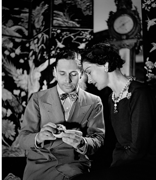
圖 2：1937 年，Fulco di Verdura 和 Coco Chanel 正在欣賞馬爾他十字手鐲。

的拜占庭藝術和建築印象深刻，尤其是拱頂上的馬賽克和鑲嵌石地板 3 。不久後便創作了第一個屬於他的馬爾他十字設計（圖 3），後來更成為他的代表作 4 。在 1930 年代使用黃金和大型多色半寶石相當大膽和革新。1935 年，著名時尚編輯 Diana Vreeland（1903-1989 年）將 Fulco 介紹給美國頂級名人珠寶商 Paul Flato（1900-1999 年），他便開始為荷里活明星和名人創作珠寶首飾。Cole Porter 的妻子 Linda 也是客戶之一，尤其鍾愛他設計的海藍寶石和紅寶石腰帶款項鍊 5 。