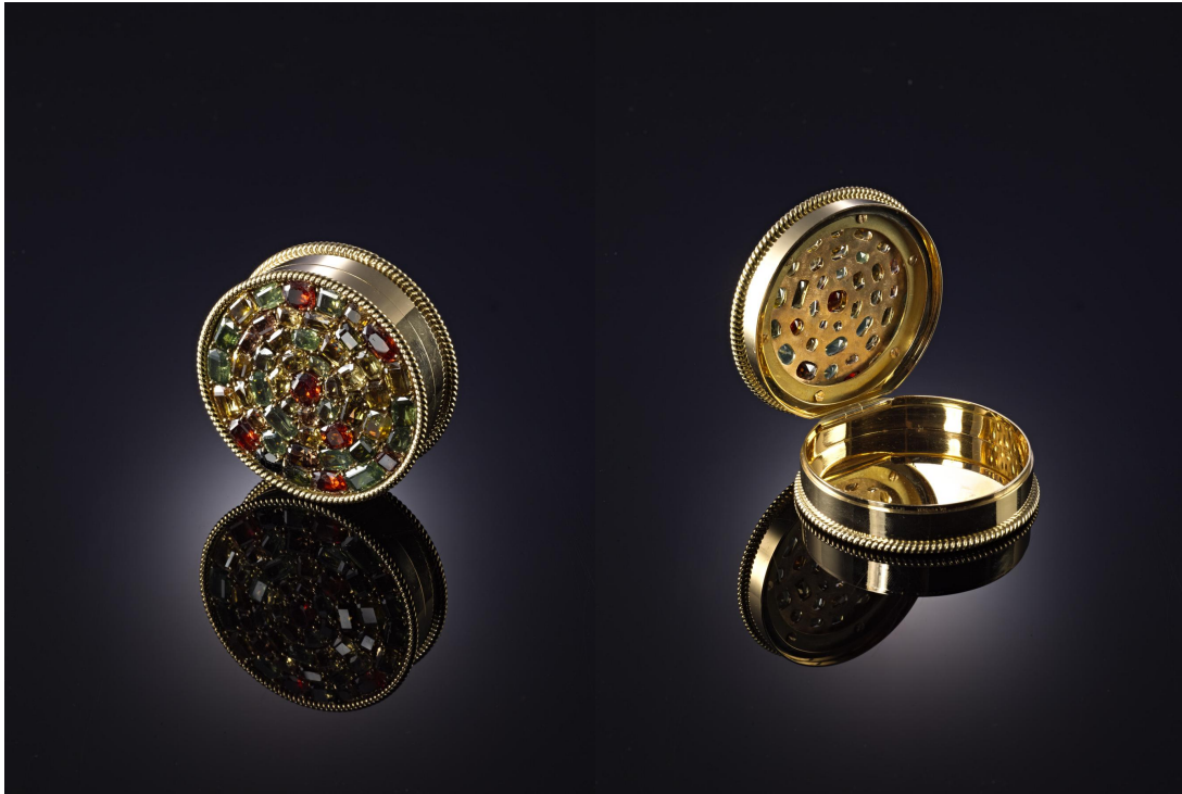
圖 9：粉盒，Verdura，約 1950 年，黃金和碧璽， 直徑 6.82 x 高 2.24 公分，兩收藏博物館藏。