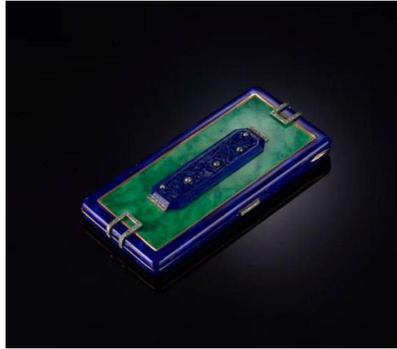
圖 4 粉盒

在兩依藏博物館的藏品中，存有 Strauss Allard Meyer 於 1920 年代到 1940 年代製作的一系列化妝盒。這款藍色矩形琺瑯盒（圖 4）是受 Lacloche 委託製作。其鑲嵌了玉石、雕琢成矩形的青金石，並附有單多面形琢型鑽石點綴。此化妝盒端部更有鏤空的鑽石細節，及鑽石鍵扣。按鍵而開，便見盒內配備的鏡子。 11 琺瑯盒包含兩個有蓋隔層及一枚鍍金的口紅支架。簡單而典雅的設計充分體現了 1920 年代的裝飾藝術風格——形狀簡潔、風格流麗。