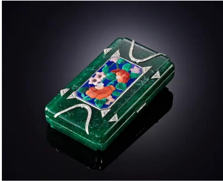
圖 9 粉盒